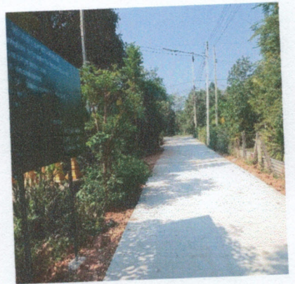
โครงการก่อสร้างถนนลาดยางแอสฟัลท์ติกคอนกรีต หมู่ ๗