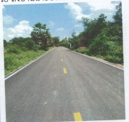
โครงการก่อสร้างถนนลาดยางแอสฟัลท์ติกคอนกรีต (บ้าน ร.ต.แสวง ถึง จ.ส.อ.อัฐศักดิ์)