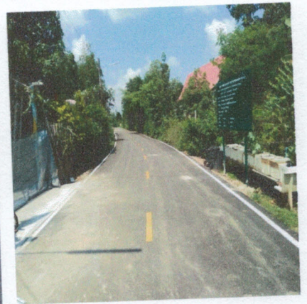
โครงการก่อสร้างถนนลาดยางแอสฟัลท์ติกคอนกรีต (บ้านนายเสวย ถึงบ้านนายประสิทธิ์)