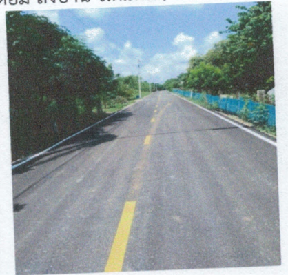
โครงการก่อสร้างถนนลาดยางแอสฟัลท์ติกคอนกรีต (สำนักสงฆ์ทุ่งแสงสว่าง ถึงบ้านนายอดิสร)