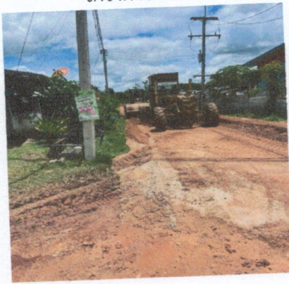
โครงการก่อสร้างถนนลาดยางแอสฟัลท์ติกคอนกรีต (บ้านหมวดต้อม ถึงบ้าน ร.ต.มนัส)